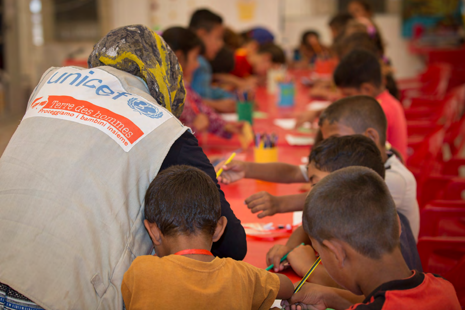
Psychosoziale Arbeit mit Kindern im Nordirak