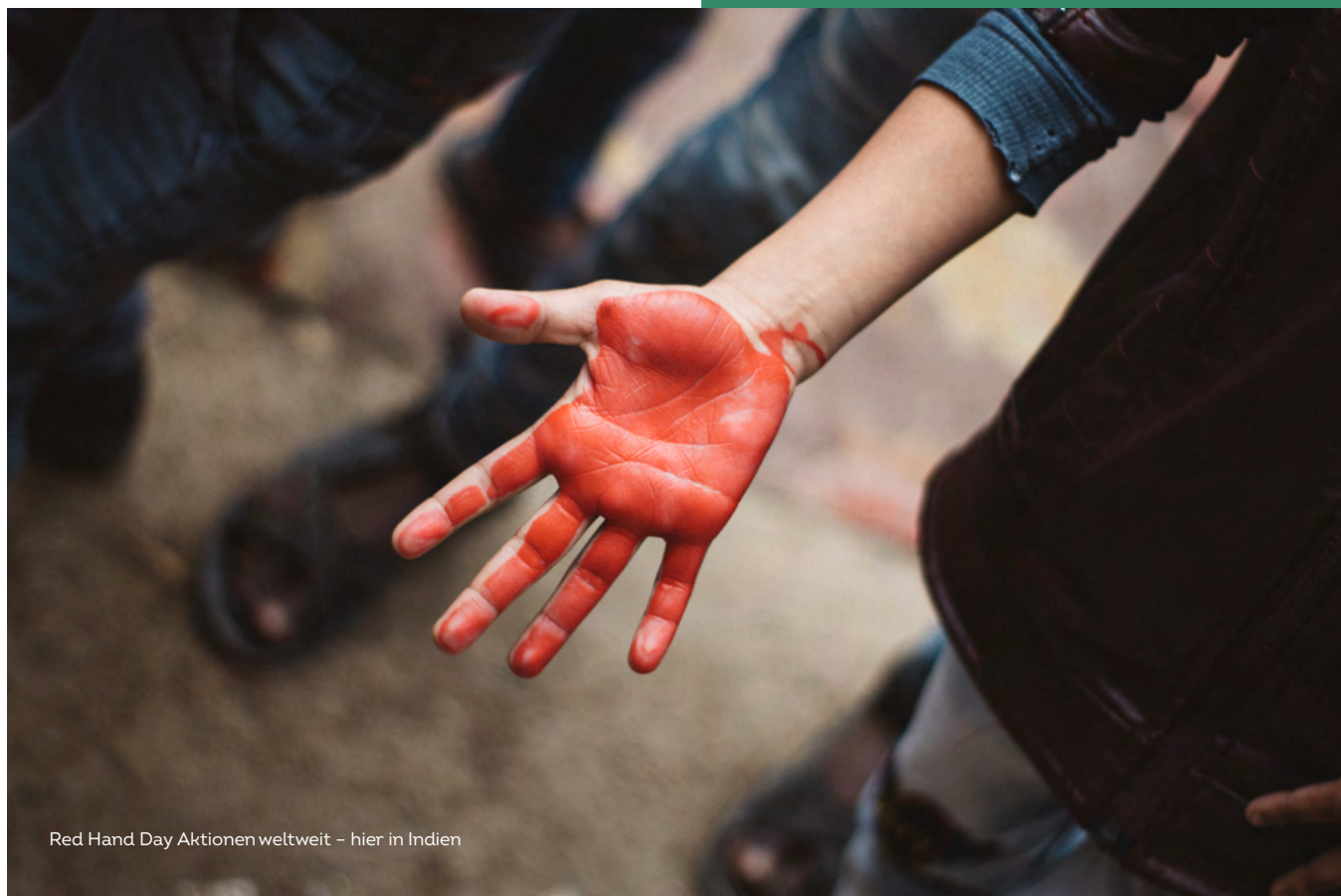
Red Hand Day Aktionen weltweit – hier in Indien